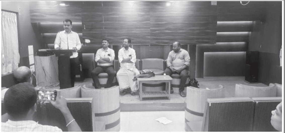
தேனி மாவட்ட புதிய நிர்வாகிகளின் பதவியேற்பு விழாவில் மாநில செயலாளர் தோழர் தமிழரசன் கலந்துகொண்டு உரையாற்றினார்